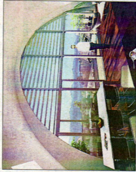
Tous les logements possèdent un immense balcon de 30 m 2 bien orienté, avec une vue magnifique sur le lac.

rari, architecte du projet. Conçues pour jouir pleinement de l'espace, les habitations offrent différents atouts. Pour commencer, elles possèdent toutes un immense balcon de 30 m 2 bien orienté, avec une vue magnifique sur le lac. A lui tout seul, il représente une vé-